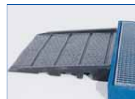
Rampa de subida de polietileno.