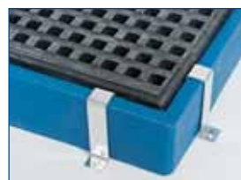
Sujeción de borde.