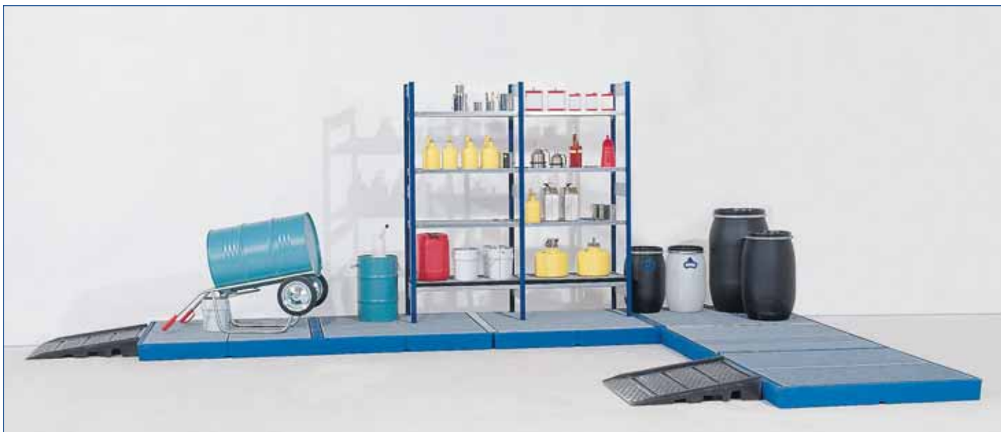
Ejemplo de combinación - 3 elementos de suelo de PE W.8828 con rampas de subida de polietileno.