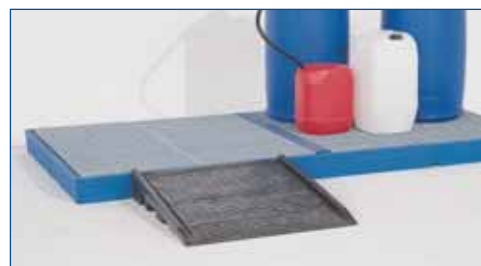
Elemento de suelo de PE con rejilla galvanizada y rampa de subida de PE.