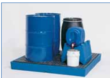
Elemento de suelo de PE W.B.8684 y caballete de PE para bidones para un almacenamiento horizontal de bidones